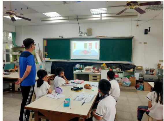
說明：利用電子白板和多媒體運用