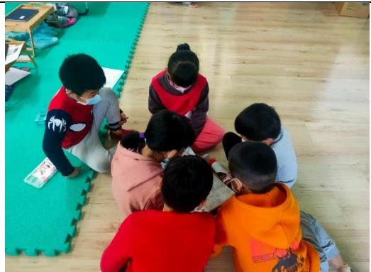
閱讀理解→小組討論交流→發表