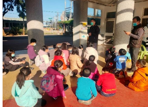
說明：上課前的叮嚀，校長、泰達主任提醒的活動注意事項。