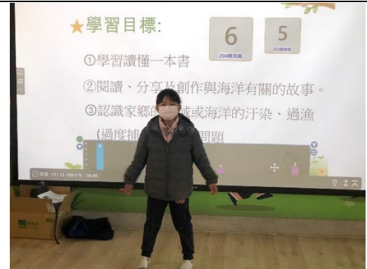
講師從旁協助問題→學生獨立發表