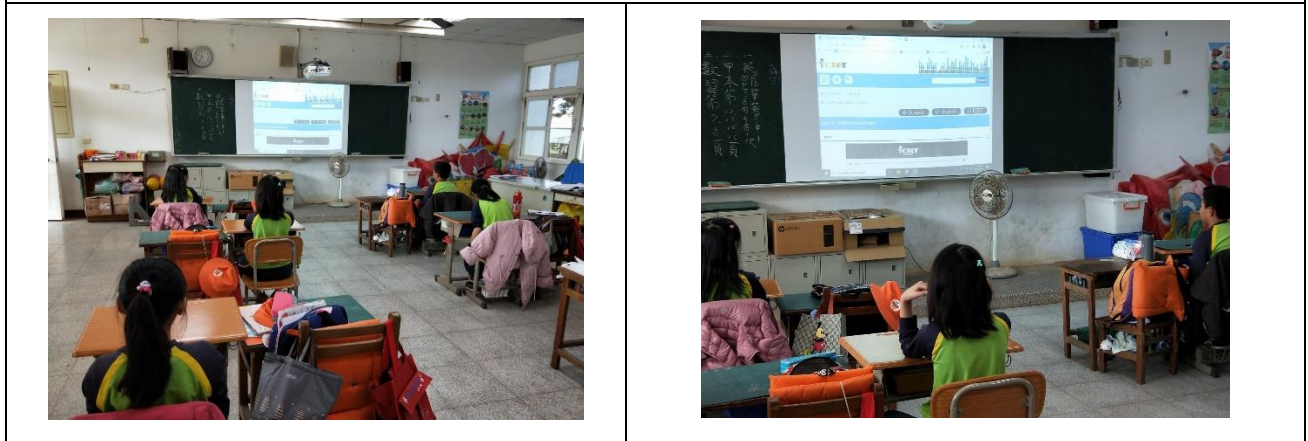
說明：利用電子白板和多媒體運用