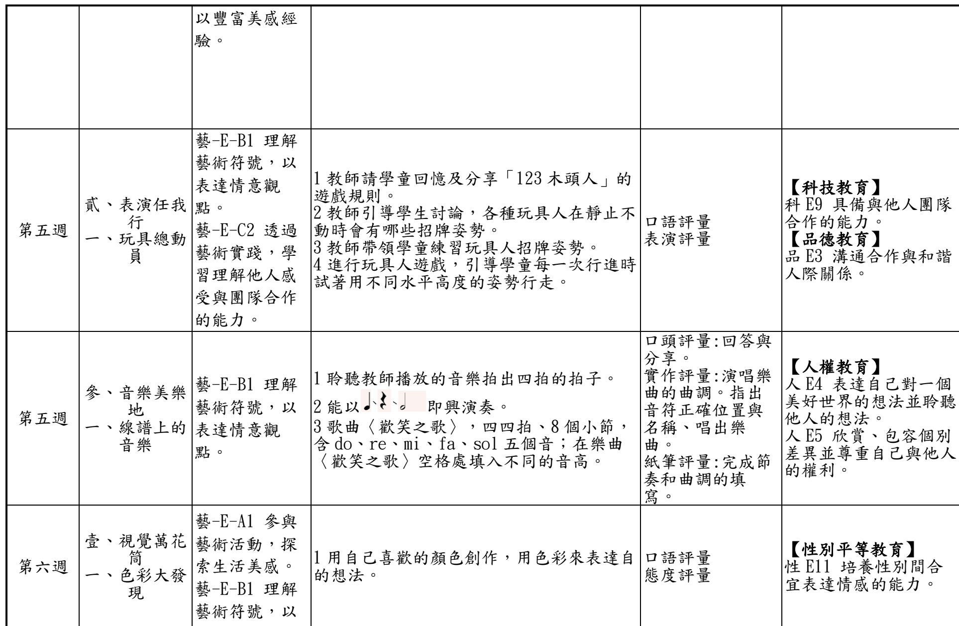
附件 2-5 (國中小各年級適用)