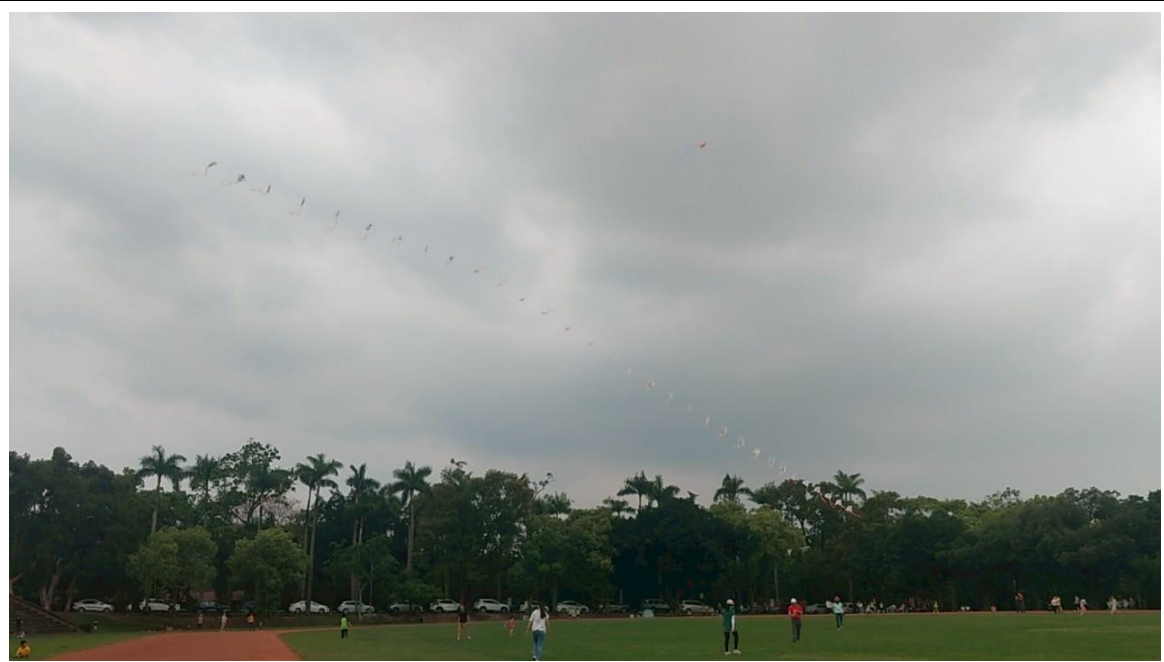
說明:練習昇放多節風箏