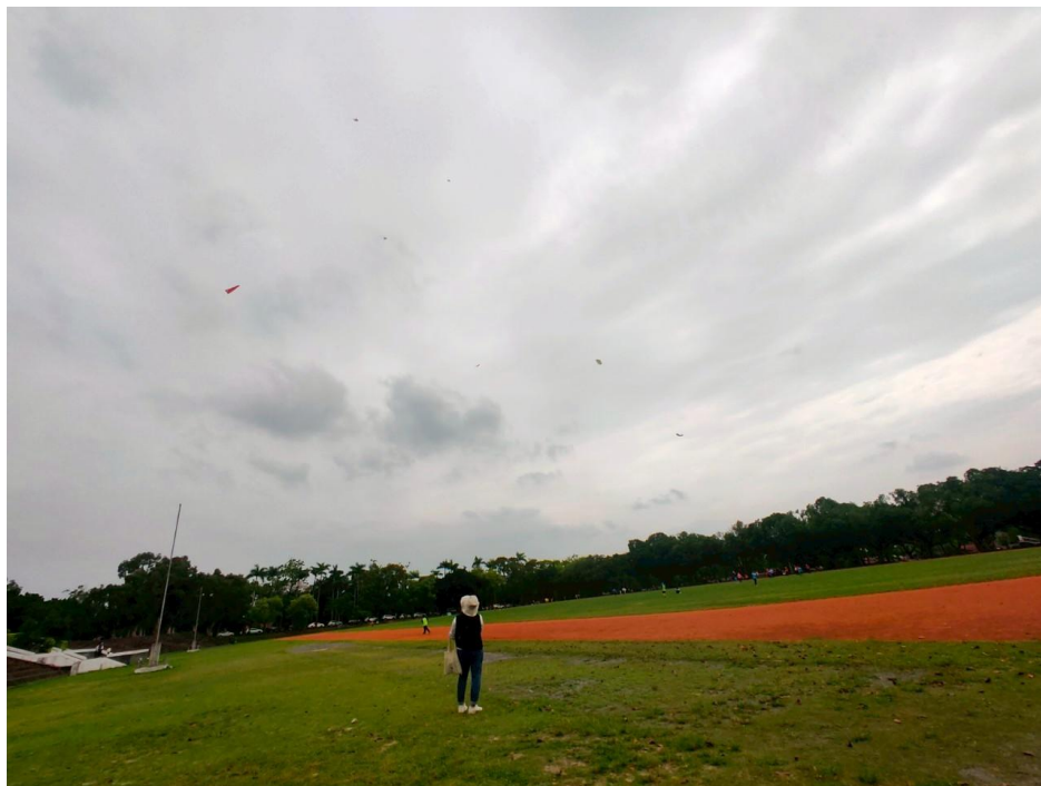
說明:練習昇放立體風箏