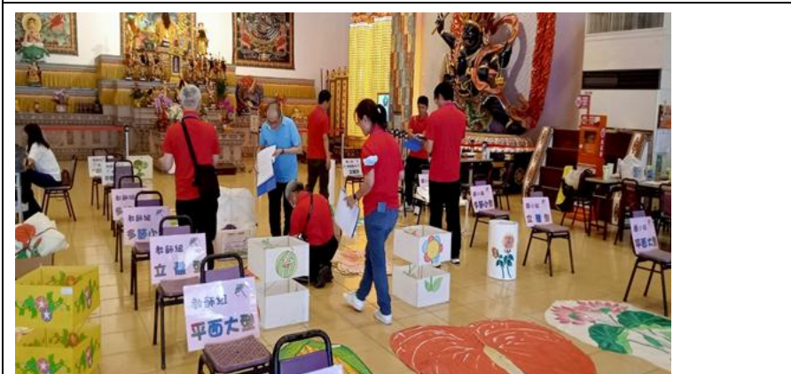
說明：民俗體育競賽