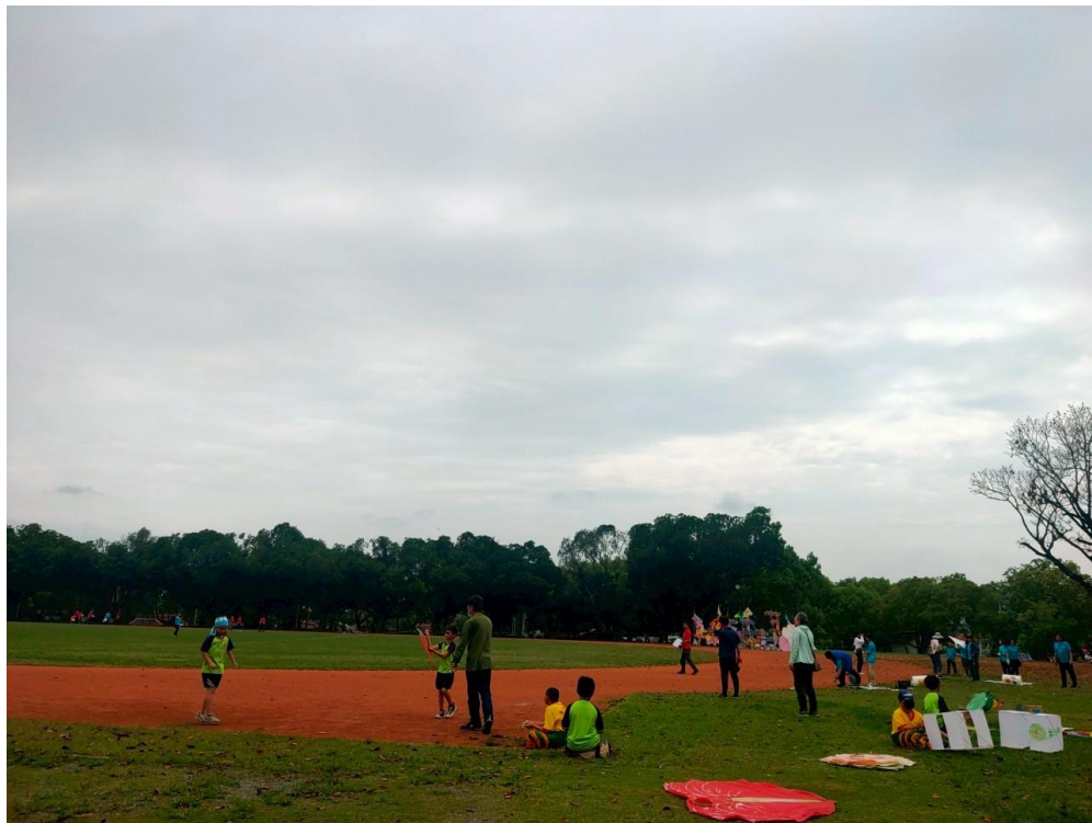
說明:練習昇放風箏