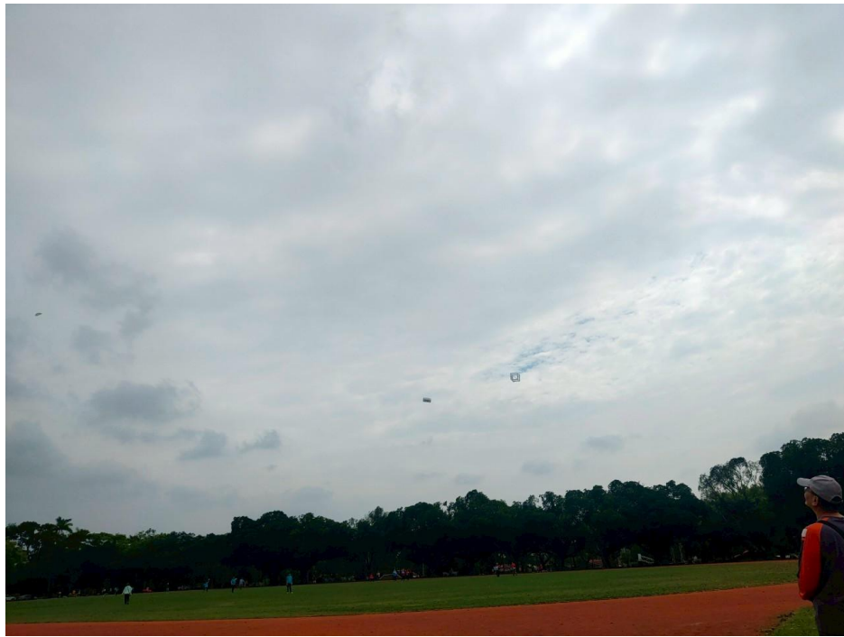
說明:練習昇放立體風箏