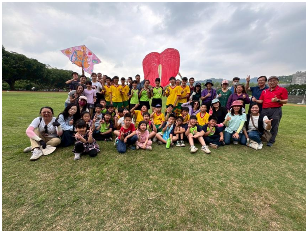
說明:參加民俗體育競賽