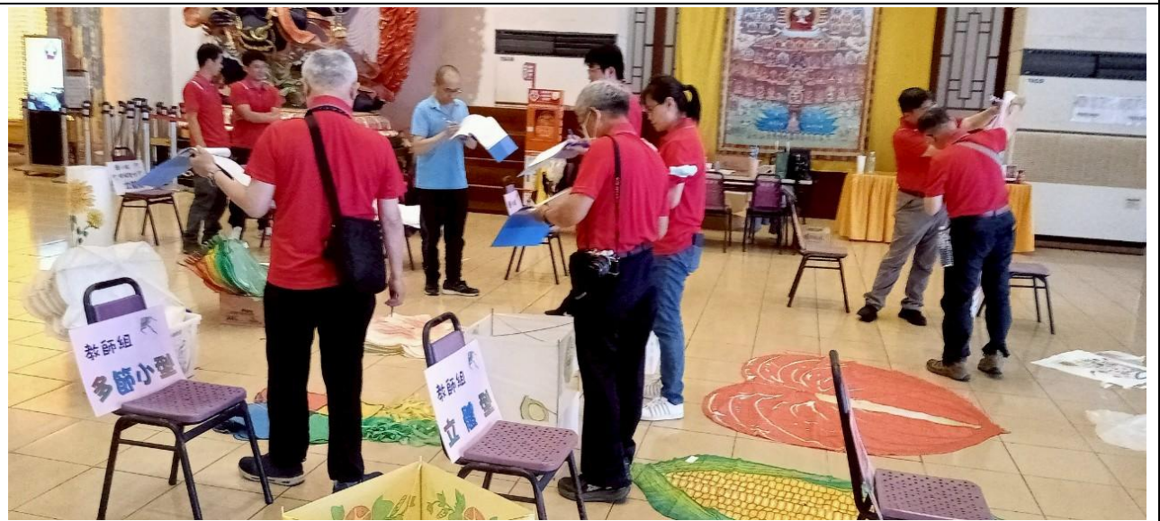
說明:參加民俗體育競賽